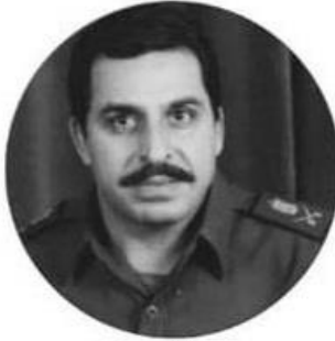
تزار الخزر جي