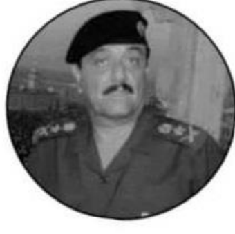
صابر عبدالعزيز الدوري