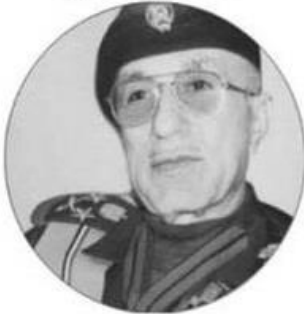
حسين رشيد التكريتي